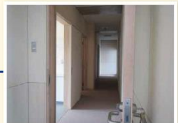
女性専用スペース